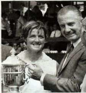
Margaret s Chris Evert (lijevo) u Parizu 1973. i u New Yorku 1969.

tri nego šest Wimbledon. Sada sam svjesna pravednosti kroz Isusa, svjesna sam da je on umro radi mene. Muhamed, Buda ni Djevica Marija nisu umrli za moje spasenje, ali Isus jest i shvatiti to je prekrasno - povjerila nam se Margaret Court.